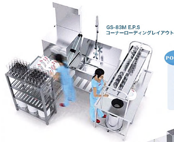
GS-83M E.P.S コーナーローディングレイアウト