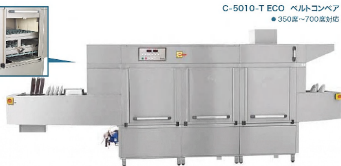
C-5010-T ECO ベルトコンベア ●350席～700席対応