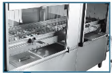
A-1200 ラックコンベア ●150席～220席対応