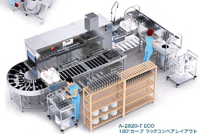
A-2820-T ECO 180°カーブ ラックコンベアレイアウト